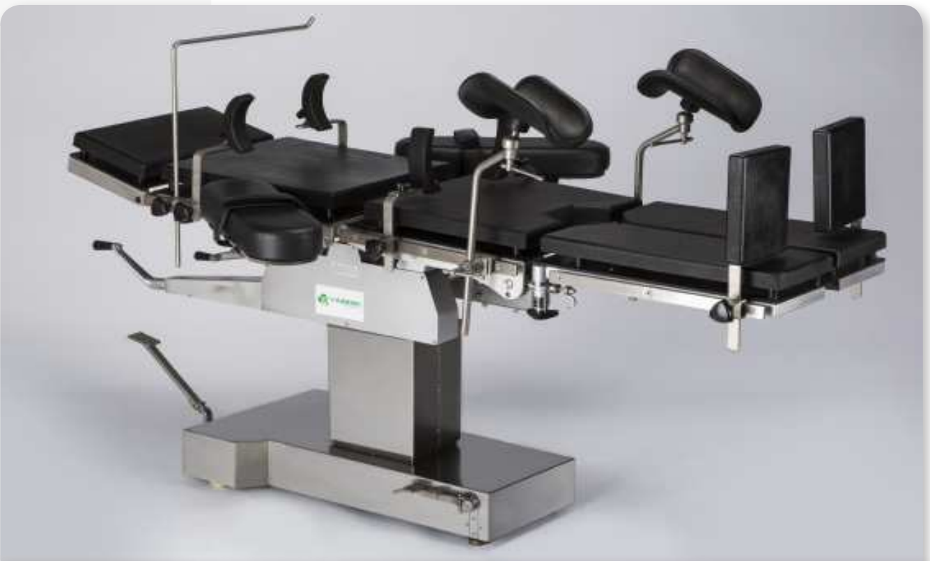
FM300 | DIMENSIONI | SIZE | DIMENSIONS | MEDIDAS | ROZMĚRY : 200 x 50 x 78 /102 H (cm)